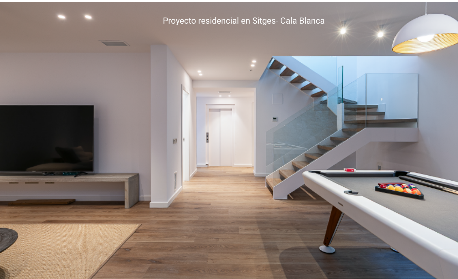
Proyecto residencial en Sitges- Cala Blanca

Colaboramos con profesionales que buscan calidad constante, estética cuidada y resultados duraderos, ofreciendo soluciones eficientes y competitivas adaptadas a cada proyecto.