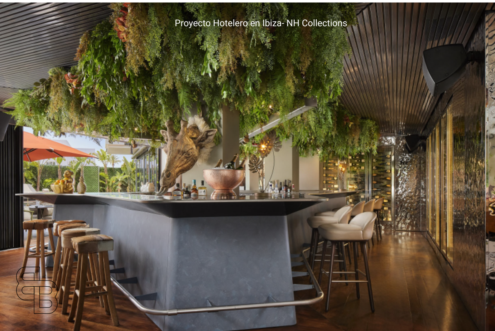
Proyecto Hotelero en Ibiza- NH Collections

Aislante acústico Base de IXPE integrada que reduce el ruido de pisadas y mejora el confort, creando un ambiente más silencioso.